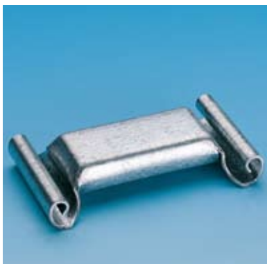
ARGUS B60 ROLHEK Solide afsluiting met behoud van zicht.